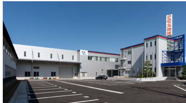
MMK 공장, 일본

백래시를 조정할 수 있습니다. 이 설계는 또한 웜 기어 톱니의 한쪽 면만 휠 기어와 접촉하여 다른 쪽의 여유 공간을 확보합니다. 그 결과, 제로 백래시에서도 2-피스 분할 기어 설계가 얽매이지 않습니다.