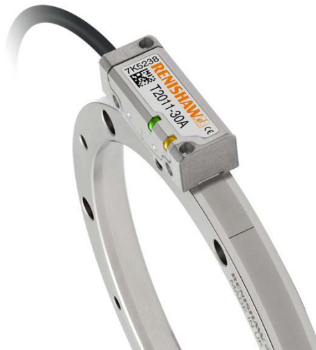
RESM 링 스케일과 TONiC™ 옵티컬 증분 엔코더

따라서 그 어떠한 모션 제어 손실이나 웜 및 휠 기어 효율도 매우 자세하게 평가해서 처리할 수 있습니다. 이제 ISO 품질 표준을 충족하는 철저한 분석이 제품 성능을 뒷받침합니다.