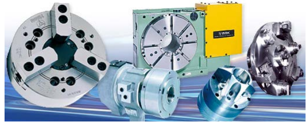
MMK의 제품 계열

공작 기계 제조업체와 사용자들이 CNC 로터리 테이블 인덱싱을 정확하게 추적 및 제어할 수 있도록, MMK는 Renishaw의 초소형 TONiC™ 비접촉식 옵티컬 증분 엔코더 시스템을 적용하기로 결정했습니다.